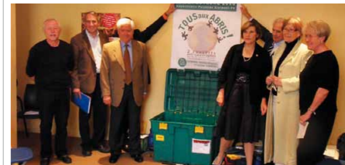
L'équipe Shelterbox lors de la conférence de presse annonçant l'événement aux journalistes de la presse locale.

Les deux clubs Clermont-Ferrand Blaise Pascal et Clermont-Ferrand Royat se sont unis pour l'organisation de deux concerts, sous le mot d'ordre "Tous aux abris", pour récolter des fonds pour Shelterbox. Le 23 octobre, le groupe vocal "Chorins" a enchanté l'amphithéâtre du Polydôme avec son spectacle musical autour de la chanson française.