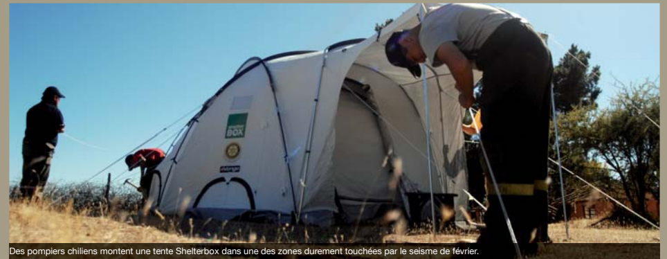
Des pompiers chiliens montent une tente ShelterBox dans une des zones durement touchées par le séisme de février.

Présent à Haïti, ShelterBox est aussi intervenu en Amérique Centrale et en Amérique du Sud en 2010.