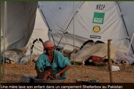
Une mère lave son enfant dans un campement ShelterBox au Pakistan

Ces pluies de la mousson ont été les plus fortes de mémoire d'homme, et elles ont causé des inondations d'une ampleur sans précédent affectant directement 20 millions de personnes.