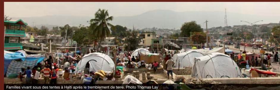
Familles vivant sous des tentes à Haïti après le tremblement de terre.