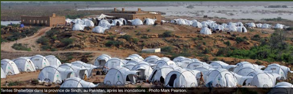
Tentes ShelterBox dans la province de Sindh, au Pakistan, après les inondations.

ShelterBox travaille au Pakistan depuis le séisme au Cachemire de 2005 et se prépare aux prochaines catastrophes. Les partenaires de ShelterBox au Pakistan comme le Programme d'Appui National Rural (NRSP) ont été indispensables pour favoriser une distribution efficace de l'aide.